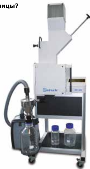
SM 300 с циклоном