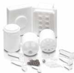
Abb. 3: Diverses Zubehör, z.B. Adapter für 2 ml Eppendorf-Tubes, Mahlbecher und Mahl kugeln (links), Schwingmühle MM 400 mit Adapter für 8 x 50 ml Falcontubes (rechts)

Die Schwingmühle MM 400 von RETSCH ist durch umfangreiches Zubehör sehr vielseitig einsetzbar, nicht nur zur Homogenisierung zäher Proben wie Sputum oder Leber. Auch zum Zellaufschluss mit Glas Beads , z. B. in single-use Gefäßen wie den konischen 50 ml Zentrifugalröhrchen oder diversen Eppendorf Tubes (maximal 20 Proben gleichzeitig), ist sie bewährt. Natürlich können auch härtere Materialien in Stahlmahlbechern oder Mahlbechern aus anderen Werkstoffen vermahlen werden. Die MM 400 ist ein bewährter Alleskönner in der Probenvorbereitung zur Fein- und Feinstzerkleinerung bis 5 µm von sowohl harten, mittelharten, spröden als auch weichen, elastischen oder faserigen Proben wie z. B. Pflanzen, Tannennadeln, Federn, Knochen, Gewebeproben, Tabletten, Holz, Mineralien oder Chemikalien . Die Schwingmühle wird außerdem für den Zellaufschluss eingesetzt. Die Mahlbecher sind in 6 unterschiedlichen Werkstoffen erhältlich, mit den Stahlmahlbechern ist auch die kryogene Zerkleinerung möglich. Für diese Anwendung bietet RETSCH das Kryokit an, in dem Becher bei -196°C in flüssigen Stickstoff gekühlt und so die Probe innerhalb des Bechers versprödet werden kann.