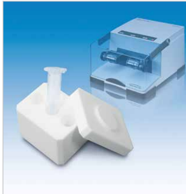
Abb. 1: Der neue Adapter für 5 ml Reaktionsgefäße erleichtert die Aufbereitung biologischer Proben in der Schwingmühle MM 400

Das von Mukoviszidosepatienten abgehustete Sputum wird üblicherweise für die mikrobiologische Routinediagnostik, aber auch für Fragestellungen in der Forschung, homogenisiert. Die Homogenisierung lässt sich sehr gut in der Schwingmühle MM 400 durchführen, allerdings war bisher die Homogenisierung von mehr als 1 ml Sputum pro Patientenprobe nur unzureichend möglich. Wurde mit 2 ml Eppendorf Tubes gearbeitet, hatte das zwar den Vorteil der minimierten Kontaminationsgefahr, jedoch bestand der Nachteil des begrenzten Probenvolumens. Für die Probenaufbereitung in der Forschung wurde daher das sehr zähe und viskose Sputum in Portionen aufgeteilt und später wieder vereinigt, was bei teilweise infektiösem Material kein geeignetes Vorgehen darstellt. Eine andere Möglichkeit der Verarbeitung ist die Homogenisierung in 5 ml Stahlmahlbechern, wobei das Sputum nicht aufgeteilt werden musste, die Mahlbecher jedoch anschließend einer gründlichen Reinigung unterzogen wurden.