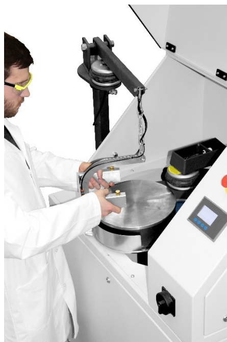
Scheibenschwingmühle RS 300 XL für große Probenvolumina

Die RS 300 XL wird für die gleichen Anwendungen eingesetzt wie die RS 200, ist aber für große Probenmengen und Ausgangskorngrößen bis 20 mm geeignet. Mit entsprechendem Zubehör können bis zu 4 Proben gleichzeitig aufbereitet werden. Der hohe Homogenisierungsgrad wird durch das sehr effektive 3D Mahlprinzip erreicht. In der RS 300 XL können Mahlgarnituren von bis zu 30 kg und Probenvolumina bis 2000 ml eingesetzt werden. Das geschlossene Mahlsystem garantiert die vollständige Vermahlung der Probe. Durch die Möglichkeit der Drehrichtungsumkehr werden Materialanbackungen weitestgehend verhindert. Eine Auswahl unterschiedlicher Werkstoffe der Mahlgarnituren ermöglicht die analysenneutrale Zerkleinerung.