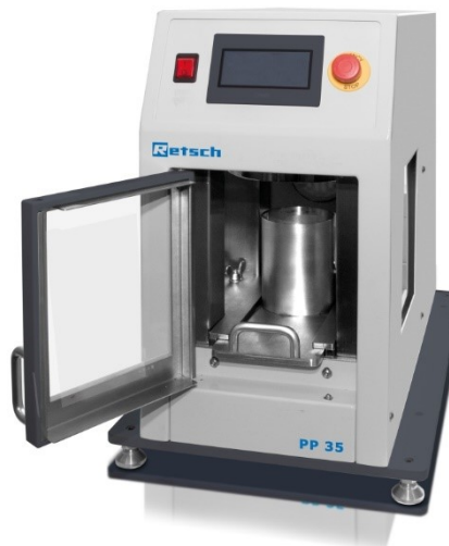
Tischgerät Pellet Press PP 35