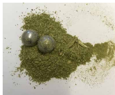
Abb. 2: Blütenknospen vor und nach der Vermahlung in einem 50 ml Zentrifugenröhrchen in der MM 400

Neben dem Zeitfaktor bietet die MM 400 einen weiteren Vorteil gegenüber dem Grinder: Der Probenverlust lag in einem tolerierbaren Bereich von 4-5%. Darüber hinaus war die relative Standardabweichung in der Regel geringer, z. B. von 5 % auf 2 % im Falle von d9-THC für eine Probe (siehe Tabelle 1).