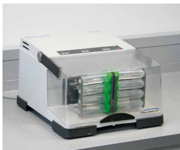
Abb. 1: Schwingmühle MM 400 mit Adapter für 8 konische Zentrifugenröhrchen

Aufgrund spezifischer gesetzlicher Vorschriften für den Umgang mit Cannabisproben stand das QSI-Team vor dem Problem, etwa 30 g Blütenknospen, die recht klebrig sein können, nach dem Zerkleinern mit minimalen Probenrückständen zu homogenisieren, um Kreuzkontaminationen zu vermeiden. Sie brauchten etwa 15 bis 30 Minuten, um 30 g Probe zu homogenisieren, plus 5 Minuten Reinigung. RETSCH stellte die Schwingmühle MM 400 einschließlich eines Adapters für 8 x 50 ml Falcon-Röhrchen vor, und man begann eine Reihe von Tests durchzuführen, um die optimalen Parameter für Probenfüllung, Mahldauer, Homogenisierungsgrad, Reproduzierbarkeit der gemahlenen Proben und Probenrückstände zu ermitteln. QSI wollte zudem etwas über den Reinigungsaufwand sowie über das Einfrieren der Probe vor dem Mahlen erfahren.