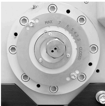
連続ギャップ幅設定用スケール

ホッパーは取り外し可能で、粉碎ジョーや側壁板も交換できるため、粉碎室の清掃がすばやく簡単に行えます。