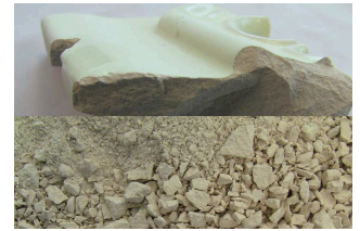
ケイ酸カルシウム