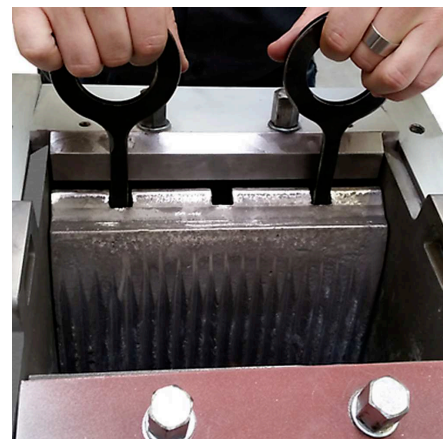
粉碎ジョーと側壁板の交換が可能