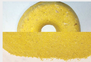
корм для животных