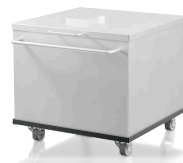
Zbiorniki na próbkę 30 l