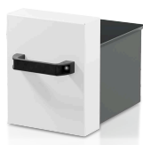
Zbiorniki na próbkę 10 l