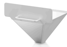
Przyłącze z wylotem grawitacyjnym do pracy ciągłej