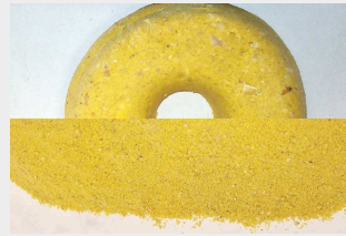
karma dla zwierząt