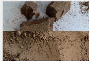
cocoa filter cake