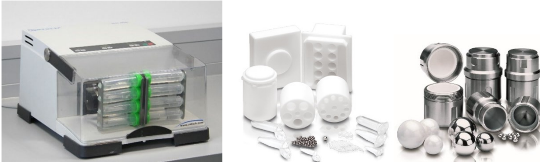
Abbildung 2: Schwingmühle MM 400 mit Adapter für 8 x 50 ml Falcons (links) und diverses Zubehör, z.B. Adapter für Eppendorf-Tubes, Mahlbecher und Mahlkugeln (rechts)

das Kryokit an, in dem Becher bei -196°C in flüssigen Stickstoff gekühlt und somit die Probe innerhalb des Bechers versprödet werden kann.