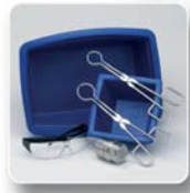
Vibro-broyeur MM 301 avec kit cryogénie

7 Pour finir, tous les échantillons sont réunis dans un bol en téflon nettoyé chimiquement puis ils sont mélangés avec une spatule jusqu'à l'obtention d'une répartition homogène de la quantité globale. Il est désormais possible de prélever un sous-échantillon en vue d'une analyse ultérieure.