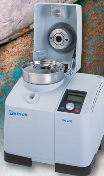
Broyeur ultra-centrifuge ZM 200

Les animaux et les plantes sont des indicateurs fiables, révélateurs de l'état de l'environnement, raison pour laquelle l'analyse d'échantillons biologiques à des fins de détection des substances contaminantes compte parmi les tâches des laboratoires environnementaux. Un grand nombre de laboratoires recourent ici aux équipements RETSCH tout à fait adaptés à une préparation d'échantillons soignée et neutre pour l'analyse. Nous en citons deux exemples, le Trace Element Research Laboratory au Texas et un laboratoire environnemental canadien.