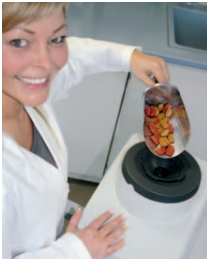
Mulino ultracentrifugo ZM 200

mediante estrazione sono sufficienti finezze in uscita nell'ordine di 0,5 - 1 mm, ottenibili accessoriando lo strumento con un setaccio anulare con foratura 0,75 - 1,5 mm. L'impiego di un setaccio con fori di dimensioni minori conduce a una separazione della materia grassa, ragion per cui per applicazioni simili la regola d'oro è "non tanto fine quanto possibile ma tanto fine quanto necessario". Per prodotti a elevato contenuto di grassi, come mangime per pesci in pellet, carni, salumi e formaggi, è preferibile utilizzare il mulino a coltelli Grindomix GM 200 . Lo strumento riduce e omogeneizza il materiale campione per effetto delle forze di taglio esercitate dalle lame all'interno di un recipiente ermeticamente chiuso. La finezza finale e il grado di omogeneizzazione dipendono dal regime di rotazione selezionato. Il processo di macinazione può avvenire anche in una fase liquida, ad esempio con aggiunta del mezzo di estrazione. Versando nel ditale di estrazione l'intero contenuto del recipiente di macinazione, è possibile escludere efficacemente qualsiasi alterazione del contenuto di grassi originale. Entrambi gli strumenti lavorano con la massima affidabilità, forniscono risultati di macinazione assolutamente riproducibili e possono essere equipaggiati con accessori per la macinazione anticontaminazione .