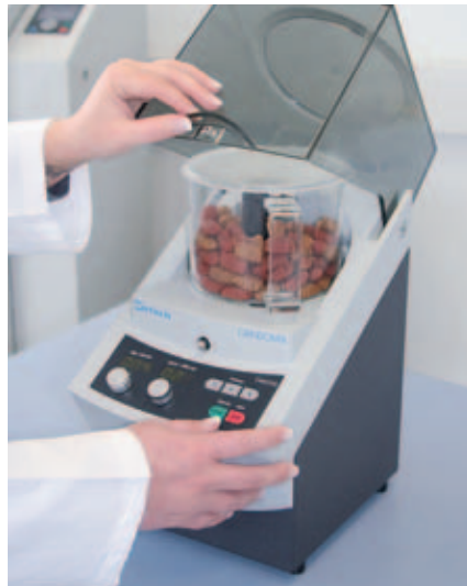
Grindomix GM 200