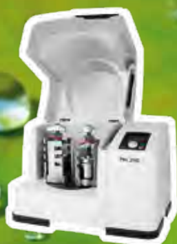
Mulino planetario a sfere PM 200 www.retsch.it/pm200