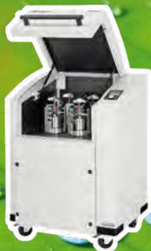
Mulino planetario a sfere PM 400 www.retsch.it/pm400